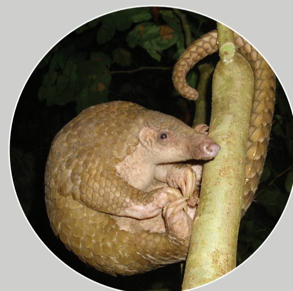
Tê Tê Philippines Manis culionensis