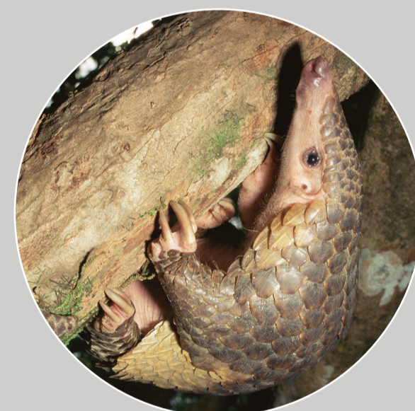
Tê Tê Java Manis javanica