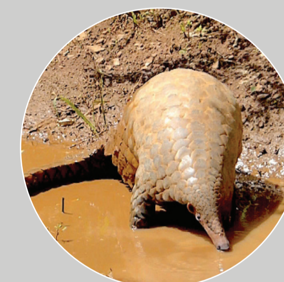
Tê Tê Đất Không Lò Manis (Smutsia) gigantea