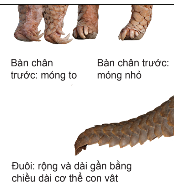
Bàn chân trước: móng to / Bàn chân trước: móng nhỏ

Các loài tê tê này sống chủ yếu trên mặt đất. Bộ móng ở bàn chân trước của chúng dài và to hơn đáng kể so với bộ móng ở cặp bàn chân sau, VÀ chiếc đuôi to và dài gần bằng chiều dài cơ thể con vật: