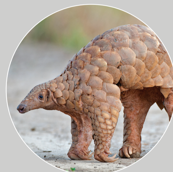
Tê Tê Ấn Độ Manis crassicaudata