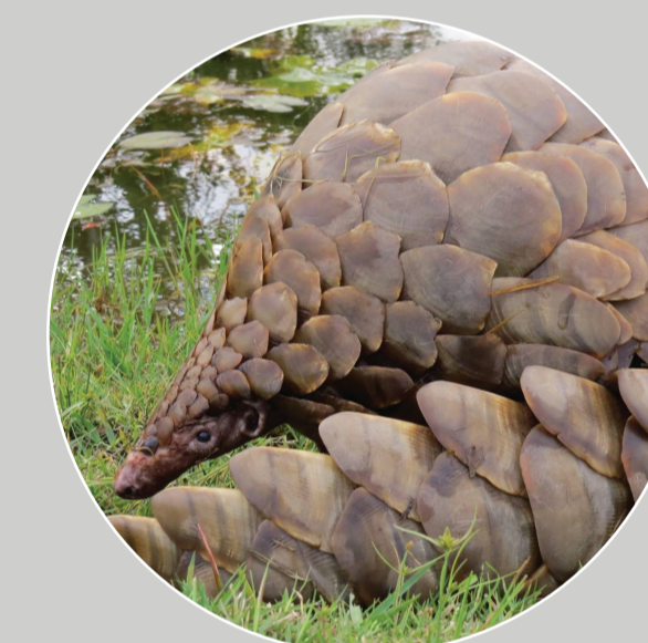
Tê Tê Đất Manis (Smutsia) temminckii

Loài tê tê châu Phi không có các sợi lông tơ nhỏ và thưa xen kẽ giữa các vảy.