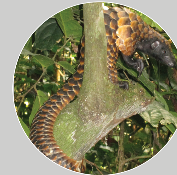
Tê Tê Bụng Đen Sống Trên Cây Manis (Phataginus) tetradactyla