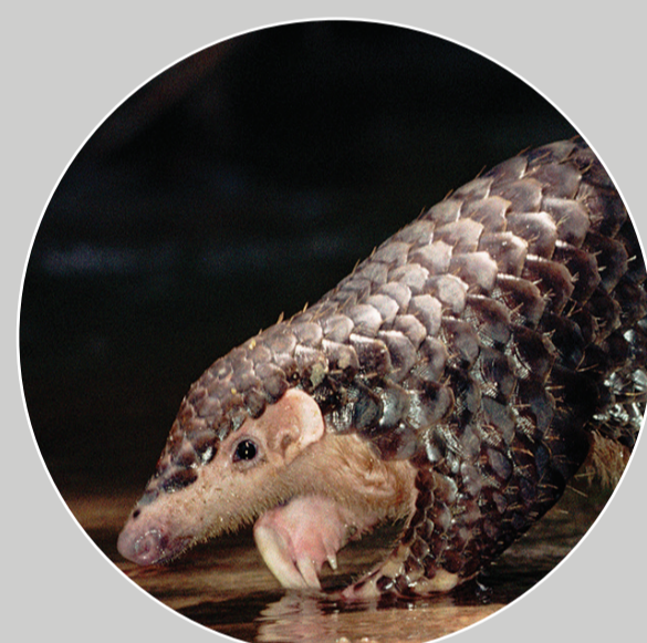
Tê Tê Vàng Manis pentadactyla

Loài tê tê châu Á có các sợi lông tơ nhỏ và thưa xen kẽ giữa các vảy.