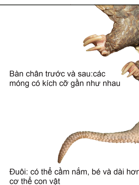
Bàn chân trước và sau: các móng có kích cỡ gần như nhau

Các loài tê tê này dành thời gian chủ yếu ở trên cây. Các móng ở tứ chi có kích cỡ khá tương đồng. VÀ đuôi có thể cầm nắm, nhỏ và dài hơn cơ thể con tê tê.