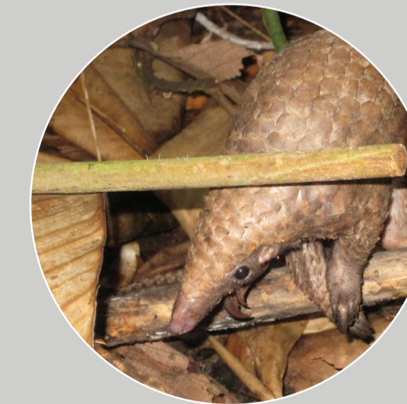
Tê Tê Bụng Trắng Sống Trên Cây Manis (Phataginus) tricuspis

ĐỂ TÌM HIỂU THÊM VỀ TÊ TÊ, HÃY VÀO TRANG WEB: http://www.usaidwildlifeasia.org/resources