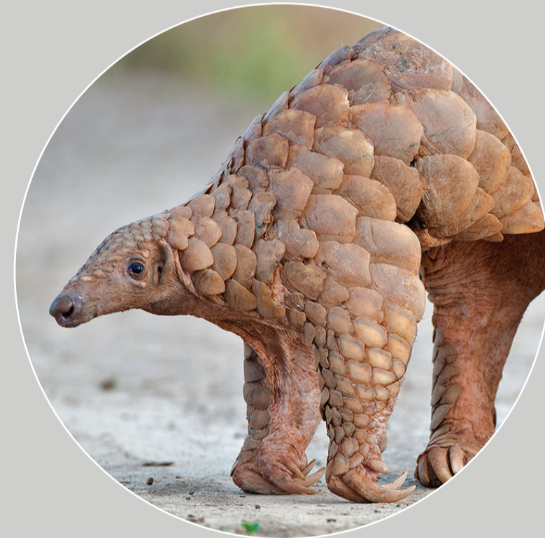
印度穿山甲 Manis crassicaudata