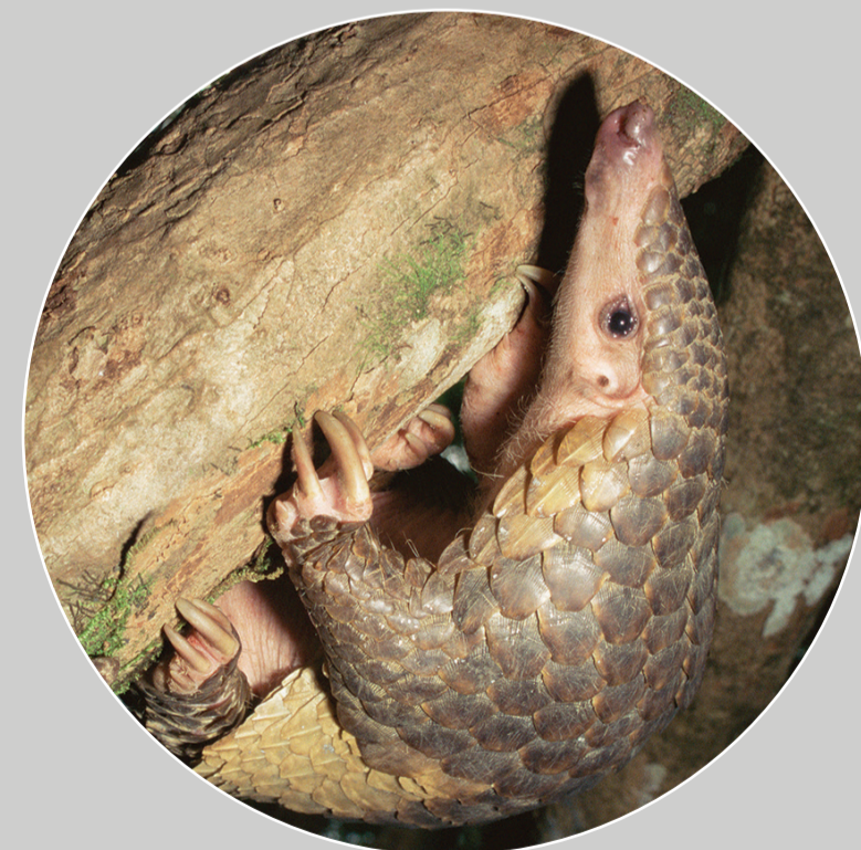
马来穿山甲 Manis javanica