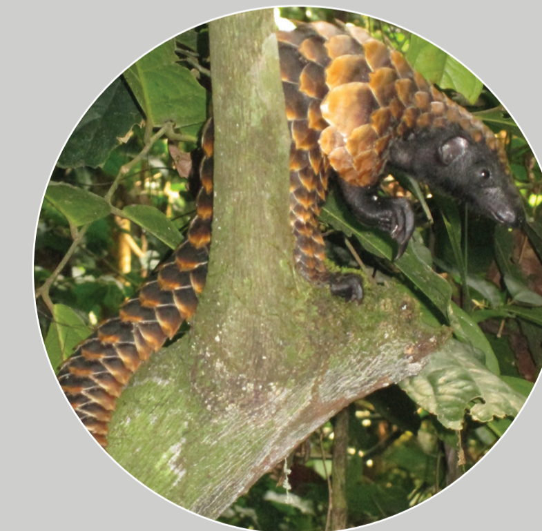
长尾穿山甲 Manis (Phataginus) tetradactyla