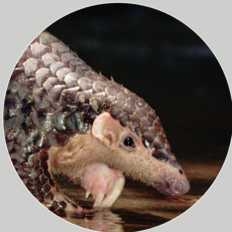
中华穿山甲 Manis pentadactyla