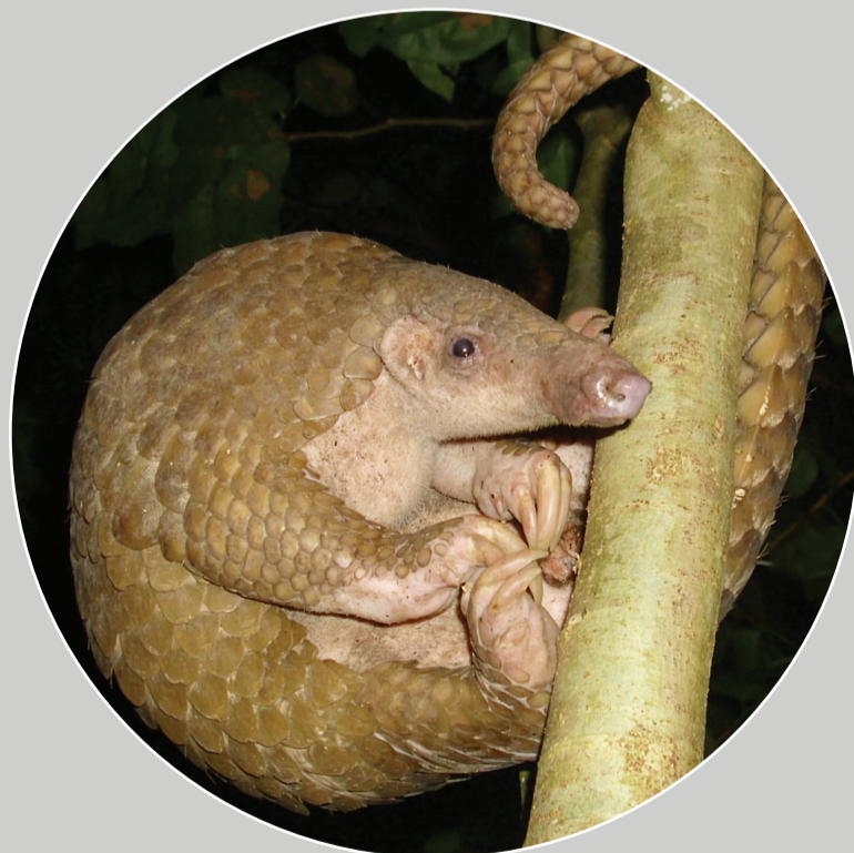
菲律宾穿山甲 Manis culionensis