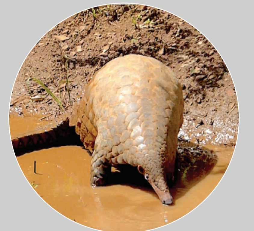
大穿山甲 Manis (Smutsia) gigantea