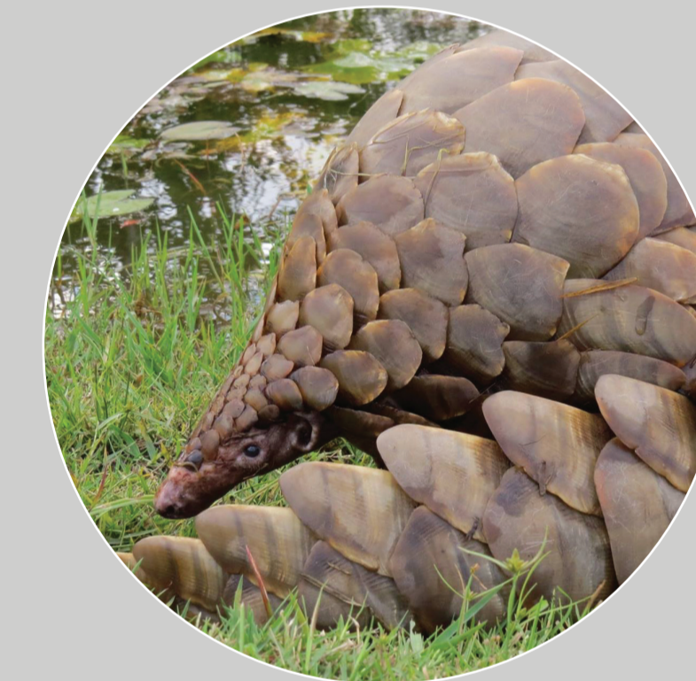
南非穿山甲 Manis (Smutsia) temminckii