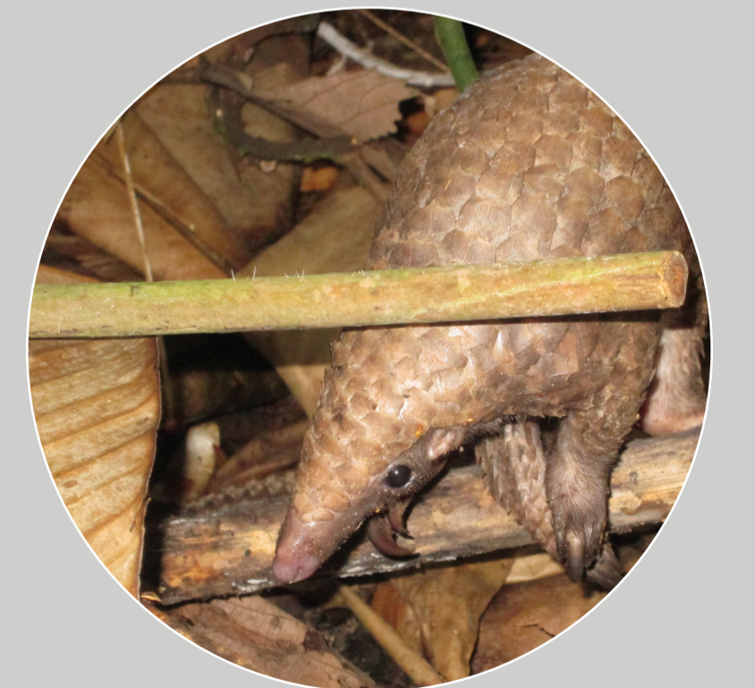
树穿山甲 Manis (Phataginus) tricuspis